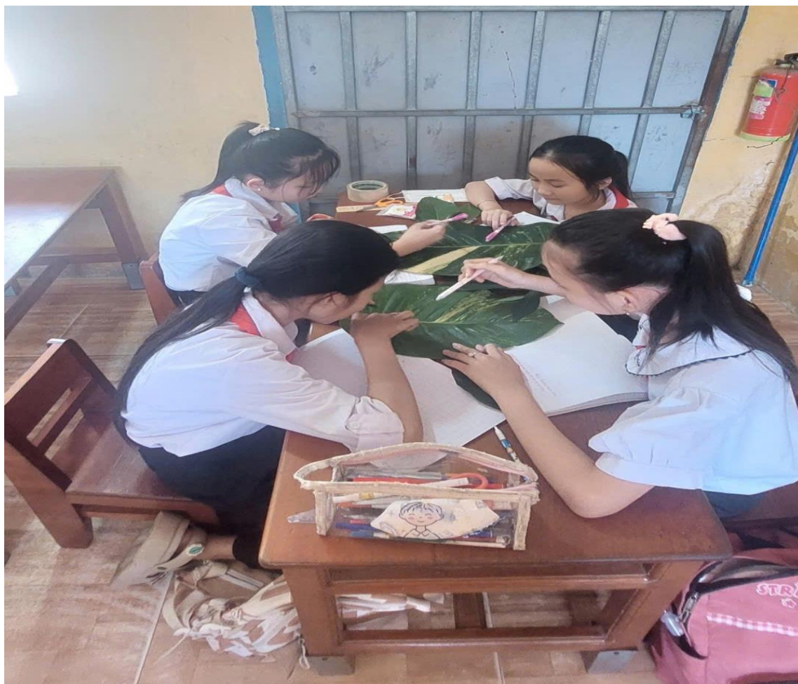
Hình 1: Học sinh quan sát cảm nhận thật về lá cây tại lớp

Khi quan sát, những đặc điểm riêng, nổi bật nhất, thu hút và gây cảm xúc mạnh nhất đến bản thân thì quan sát trước, tả trước, các bộ phận khác tả sau.