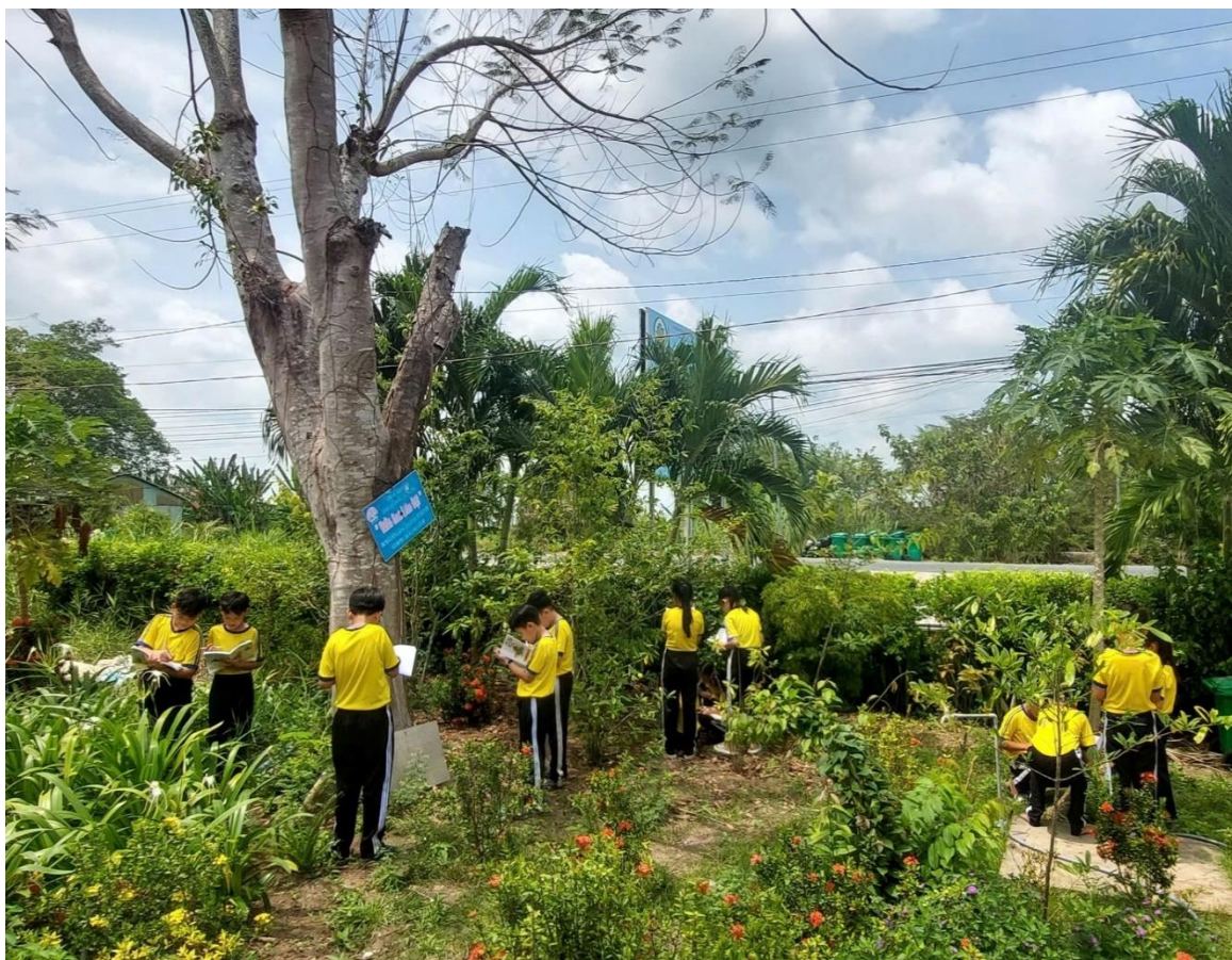
Hình 3: Học sinh quan sát trực tiếp cây cối trong trường học

Với bài tập này, tôi tổ chức cho học sinh quan sát cây cối trong khuôn viên nhà trường. Học sinh sử dụng các giác quan để quan sát theo trình tự hợp lí, sau đó ghi chép lại kết quả và báo cáo.